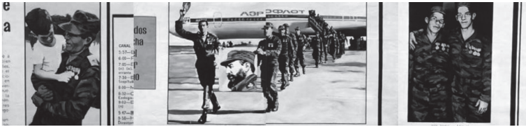
Tania Angulo, Juan P. Ballester, José A. Toirac, Triptico , 1991, óleo sobre tela, 180-720 cm, Ludwig Forum für Internationale Kunst Aachen, en préstamo de la Fundación Peter e Irene Ludwig.

en fotografías reproducidas en Granma , el órgano oficial del Partido Comunista Cubano. En la tabla izquierda se ve un militar, muy condecorado y con un niño en su brazo; en la tabla derecha dos militares abrazados, también con muchas condecoraciones; y, en la tabla del medio, dos soldados que llevan una tela con el retrato de Fidel Castro, seguidos por otros más que bajan de un avión soviético de Aeroflot. Se nota el énfasis en la imagen de héroe militar, con medallas, uniforme camuflado, un niño como promesa para el futuro, el eslogan afirmativo del texto “Pedro y Miguel irán”, y, por supuesto, la foto de Fidel.